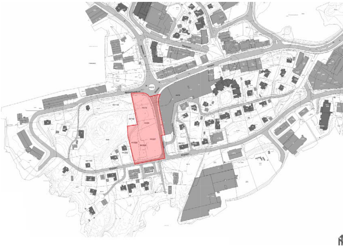
Oversiktskart (uten skala)

I henhold til plan- og bygningsloven §12-8 varsles med dette igangsetting av arbeid med detaljregulering for "AMFI Finnsnes 2 - Plan ID 1931201603". Planområdet omfatter hele eller deler av gnr/ bnr 44/ 6, 44/ 221, 44/ 328, 44/ 329, 44/ 73, 44/ 94, 44/ 972 og 44/ 1057 i Lenvik kommune.