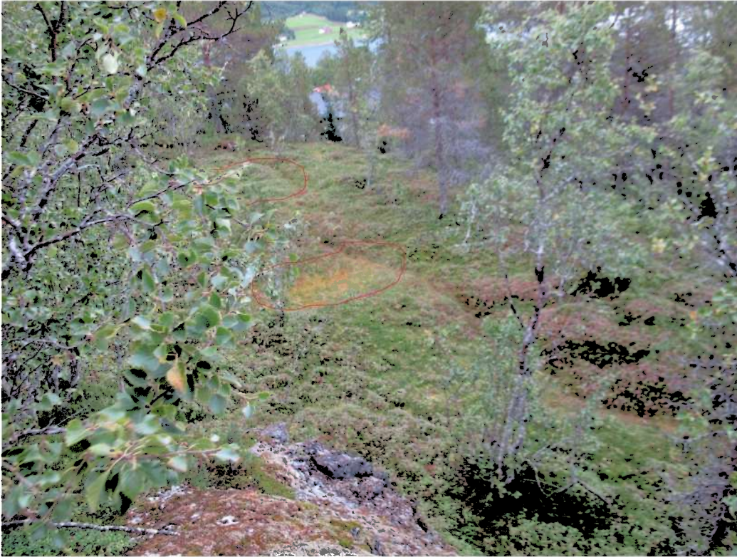
Figur 3 Moglege tufter markert i Raudt

også lokalisert nokon interessante vollar nord-aust for planområdet, men da terrenget der var for fuktig og samtidig utanfor planområdet, vart disse ikkje prøvestokke (fig. 3).