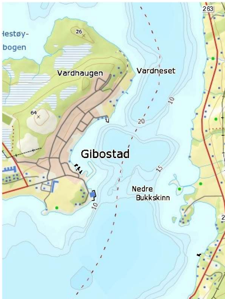
Figur 1 Gibostad område

Planområdet omfattar GNR/BNR 84/2. 84/3. 84/23. 84/48. 84/141. 84/181. 84/210. 84/211. 84/215. 84/223. 84/232. 84/243. 84/245.