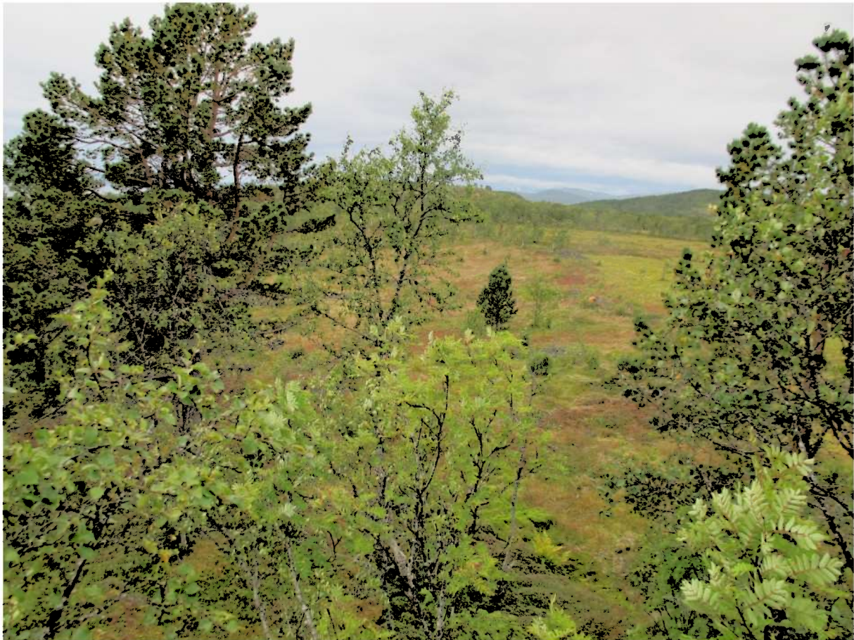
Figur 2 Strandvollane nedan for myra

Denne høgda har i si tid vært eit nes som stakk ut i Gisundet med ei høgde i kvar ende. Flata imellom desse høgdena er i dag ei myr. Strandflatane ned mot Markveien er dekt med myr vekster og lyng, myr er også å finne på enkelte flatar. I den austre delen ved Vardehaugen var der lett furuskog og langs den vestre delen på strandvollane var der enkeltstående bjørketre.